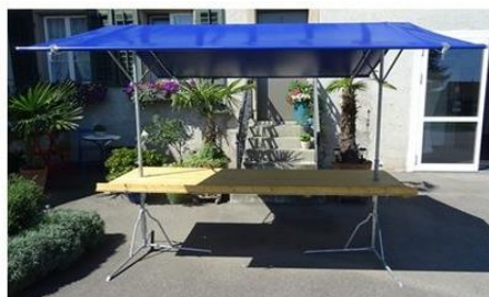
Tischplatte: Breite 3m / Tiefe 1m